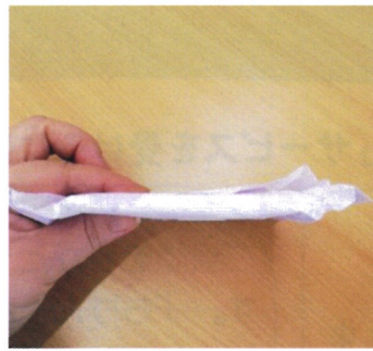
これは 200 cc です！